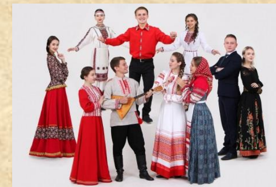
Ансамбль народной песни «Жар-птица»