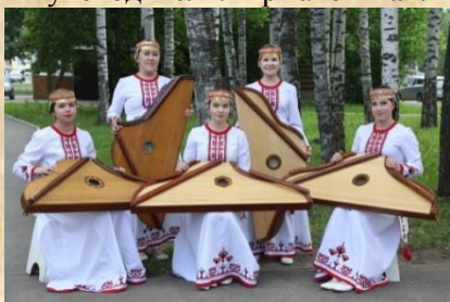
Ансамбль гусяров «Чинчывий»