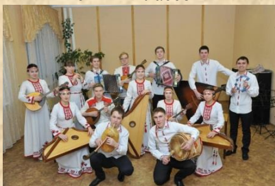
Ансамбль «Памаш шинча» («Родничок»)